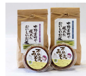
なかのほう味自慢2点セット

注文番号: 6 3,600円 内容: 中野方坂折棚田米(コシヒカリ)1升×2袋、不動滝みそ700g×2パック