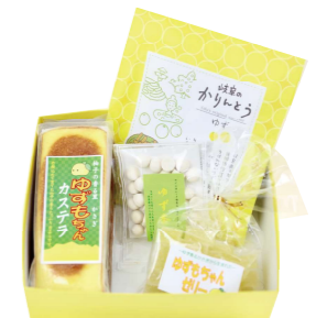
ほんのごあいさつセット

内容: ゆずカステラ1本、ゆず羊羹1本、ゆずゼリー1袋、ゆず香1袋、ゆずかりんとう1袋