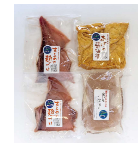
飯地の味おためしギフト

注文番号: 3 3,500円 内容: するめのこうじ漬け2枚、あげの醤油漬け5枚、手づくりこんにゃくにゃく2玉