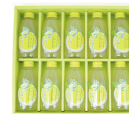
ゆずジュースセット