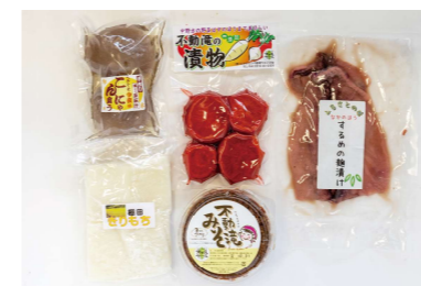
なかのほう ばあちゃんの手づくりセット

注文番号: 5 4,500円 内容: 切りもち1キロ、手づくりさしみこんにゃくにゃく2玉、かぶら漬250g、不動滝みそ700g、するめの糍漬1枚