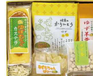
ゆず香るお茶うけセット

内容: おろしポン酢1本、濃口ポン酢1本、ゆべし(丸)1つ、焼肉のたれ(大)1本、ゆずしぼり果汁1本