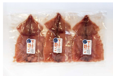
飯地するめのこうじ漬け 3枚入りギフト

注文番号: 1 5,050円 内容: するめのこうじ漬け3枚、あげの醤油漬け10枚、手づくりこんにゃく4玉