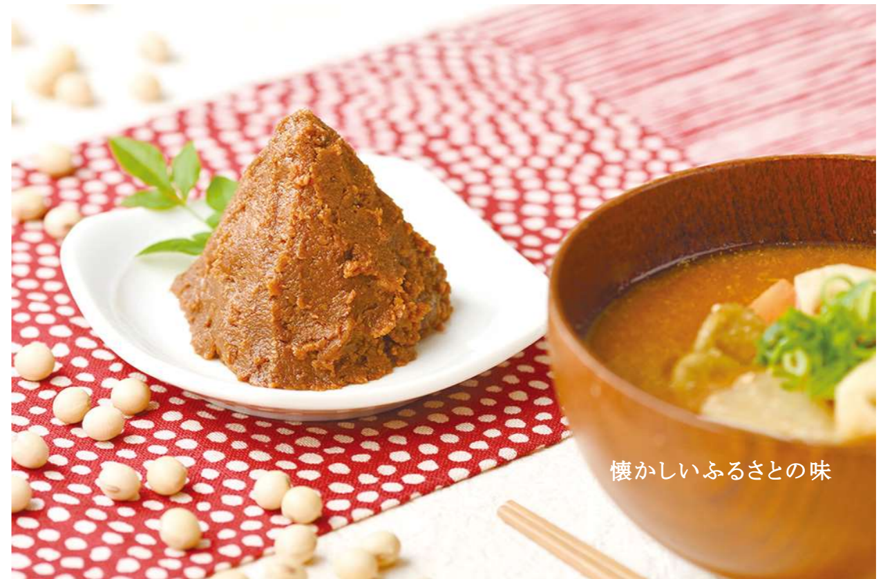
懐かしいふるさとの味