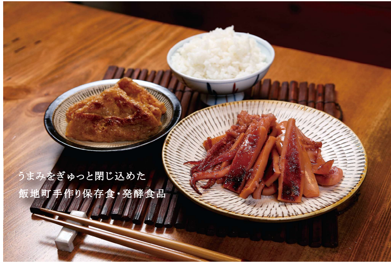
うまみをぎゅっと閉じ込めた 飯地町手作り保存食・発酵食品