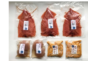
飯地ぜいたくギフト

注文番号: 1 5,050円 内容: するめのこうじ漬け3枚、あげの醤油漬け10枚、手づくりこんにゃく4玉