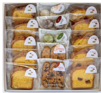
まめくら洋菓子セット

内容: からすみ1本、焼き万頭5個、干し柿3個、フキの砂糖漬け菓子2袋、げんこつ飴2袋