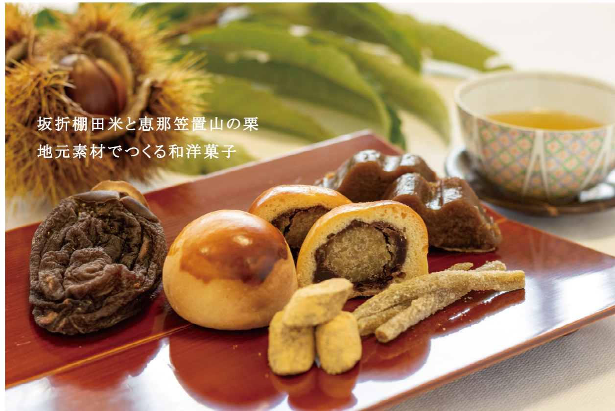
坂折棚田米と恵那笠置山の栗 地元素材でつくる和洋菓子