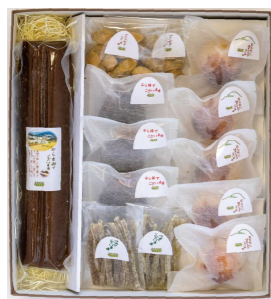
まめくら和菓子セット