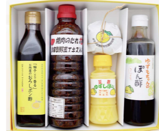
もぎたてゆず調味料セット