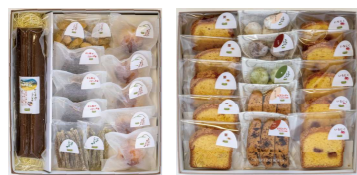
まめくら豪華セット(まめくら和菓子セット + まめくら洋菓子セット)

内容: からすみ1本、焼き万頭2個、パウンドケーキ(栗・イチジク)各1個、スノーボール(プレーン・茶・ココア)各1袋