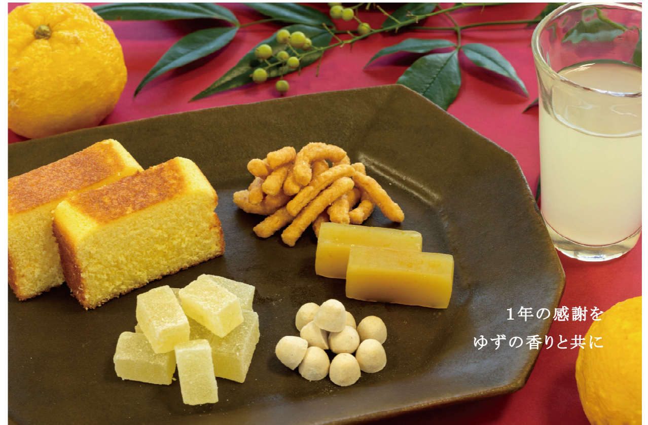
1年の感謝を ゆずの香りと共に