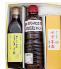
かさぎ味自慢セット